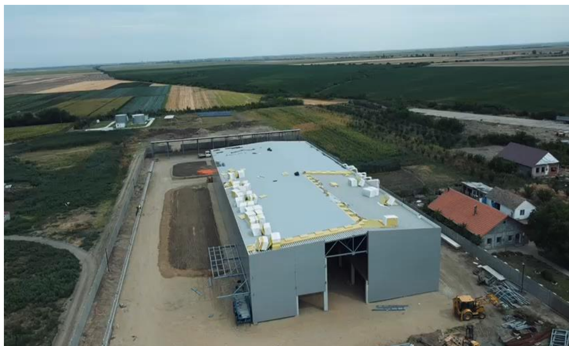
Fig. 1 - CLF Tomnatic